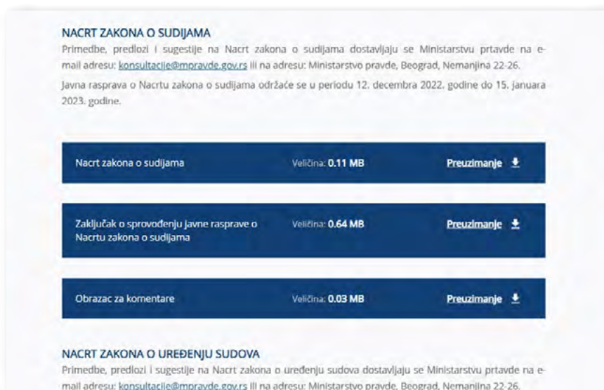
Prikaz internet strane Ministarstva pravde.

U skladu sa zakonskim obavezama Izveštaj o sprovedenoj javnoj raspravi objavljen je na internet prezentaciji Ministarstva pravde u roku kraćem od 15 dana, preciznije 25. januara 2023, 21 u kojem su predstavljeni komentari i predlozi koji su pisanim putem prikupljeni tokom javne rasprave, informacije ko je podnosilac predloga, kao i kratka obrazloženja zašto je predlog prihvaćen ili odbijen. Na osnovu pregleda Izveštaja utvrđeno je da je manje od 10% predloga učesnika javne rasprave prihvaćeno. Takođe, analiza Izveštaja pokazuje da obrazloženja za odbijanje predloga u velikom broju neadekvatna, bez pravno utemeljenih razloga za odbijanje predloga.